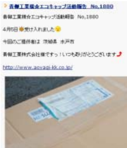
回収業者ホームページの記事です